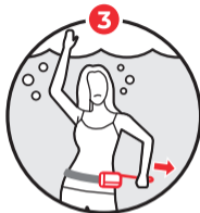
위급상황 시 트리거 당김! 튜브팽창 Trigger pulled in emergency