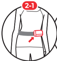
허리에 장착하고 즐거운 레저타임! Wear on the waist (front, back)