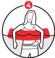
튜브에 매달려 구조대기 Waiting for rescue in tube