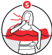
휘슬을 불어 도움요청 Whistle for help